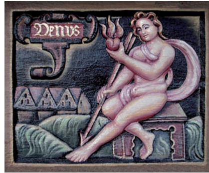
◀◀ Brüstungsbild Venus (alt)