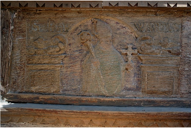
▲ Abgebeitztes Brüstungsbild St. Bernward

konnten, wurden zusätzlich weiteren Analysen unterzogen. Diese sollten Auskunft über die verwendeten Pigmente und Bindemittel geben.