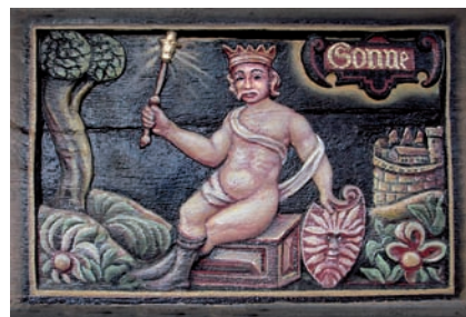
◀◀ Brüstungsbild Sonne (alt)